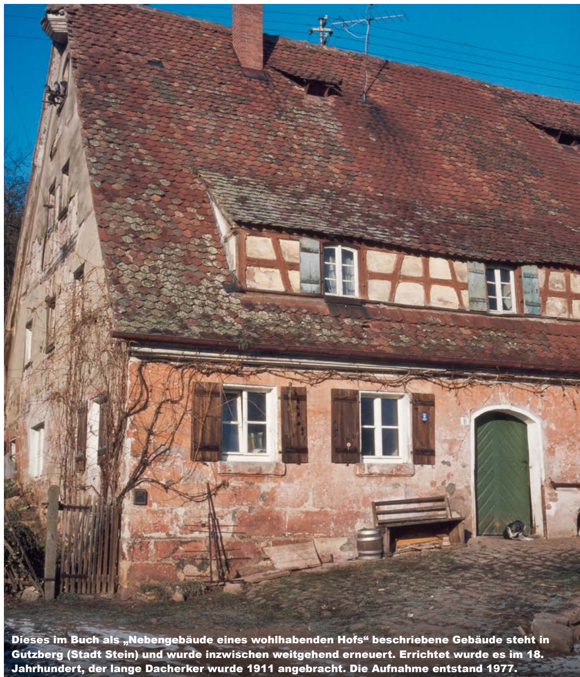
Dieses im Buch als „Nebengebäude eines wohlhabenden Hofes“ beschriebene Gebäude steht in Gutzberg (Stadt Stein) und wurde inzwischen weitgehend erneuert. Errichtet wurde es im 18. Jahrhundert, der lange Dacherker wurde 1911 angebracht. Die Aufnahme entstand 1977.

Rund 400 Farbaufnahmen, allesamt entstanden vor dem Jahr 2002, hat Konrad Bedal für den Band ausgesucht. Was die allermeisten zeigen, hat er eingangs des Buches wie folgt beschrieben: „inzwischen verschwundene, abgebrochene Bauernhäuser und ihre Nebengebäude, die, obwohl das Aufnahmedatum nur wenige Jahrzehnte zurückliegt, eine andere, von körperlicher Arbeit dominierte Lebenswelt dokumentieren – eine ländlich-dörfliche Welt, noch nicht völlig geprägt von motorisierter Mobilität, von glattgebügelter Umgebung, dafür manchmal durchaus liebevoll gepflegt, oft auch aus unserer Sicht harmonisch eingebettet in die dörfliche und landschaftliche Umgebung“. Darunter befinden sich auch Aufnahmen von stark