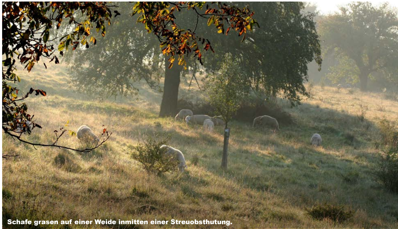
Schafe grasen auf einer Weide inmitten einer Streuobstthutung.

Die Ausstellung zeigt, wie das Zusammenspiel von naturräumlichen Gegebenheiten und menschlichem Wirken die Region über Jahrhunderte hinweg geprägt hat und bis heute prägt. Mit den Kulturlandschaften stehen also auch die Menschen, ihre Arbeit und ihre Geschichten im Fokus, ebenso wie die reiche Tier- und Pflanzenwelt Frankens. Ab 25. Juni 2026 wird die Ausstellung zunächst in Treuchtlingen zu sehen sein und anschließend durch ganz Mittelfranken wandern.