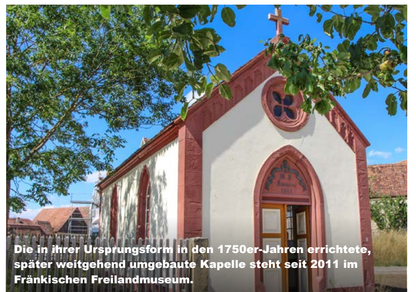
Die in ihrer Ursprungsform in den 1750er-Jahren errichtete, später weitgehend umgebaute Kapelle steht seit 2011 im Fränkischen Freilandmuseum.