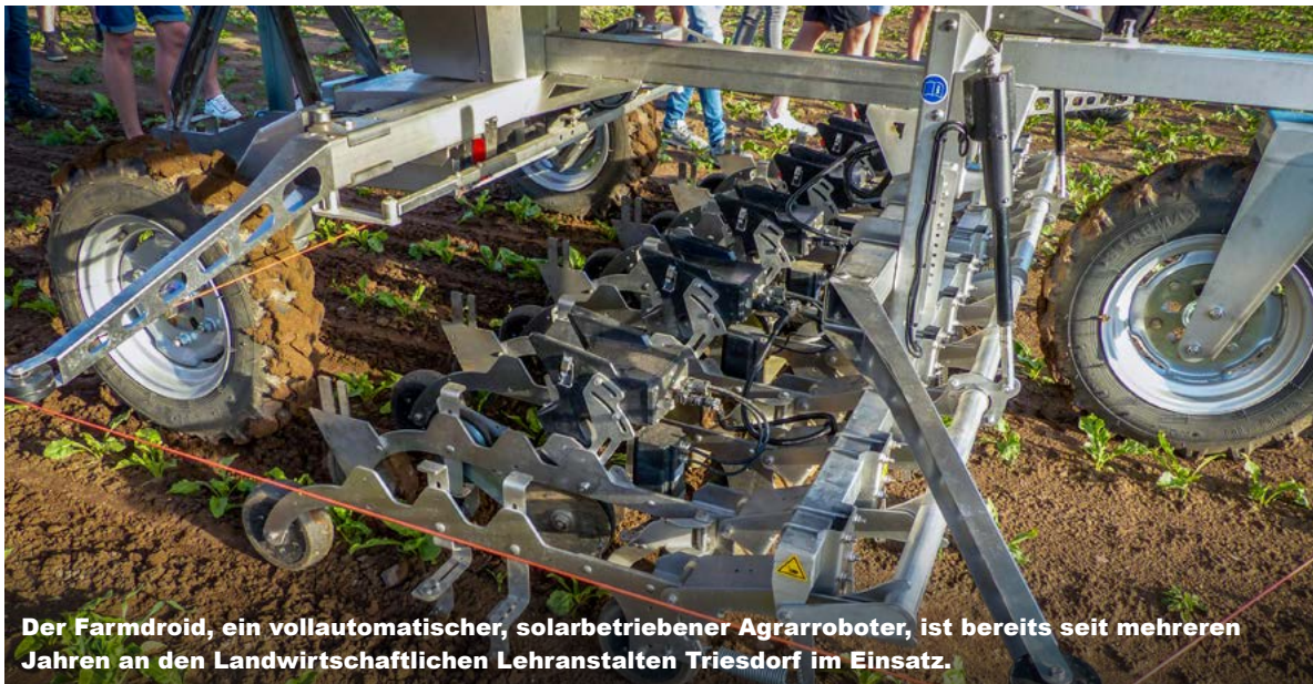
Der Farmdroid, ein vollautomatischer, solarbetriebener Agrarroboter, ist bereits seit mehreren Jahren an den Landwirtschaftlichen Lehranstalten Triesdorf im Einsatz.

Bildung Zwischen Tradition und Zukunft: Landwirtschaft steht vor tiefgreifendem Wandel.