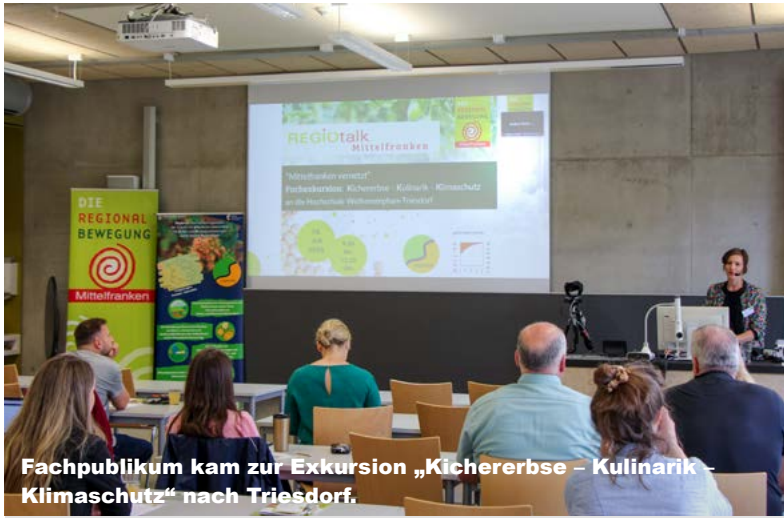
Fachpublikum kam zur Exkursion „Kichererbse – Kulinarik – Klimaschutz“ nach Triesdorf.

Natur & Umwelt Dialogreihe für mehr Regionalität in Mittelfranken.