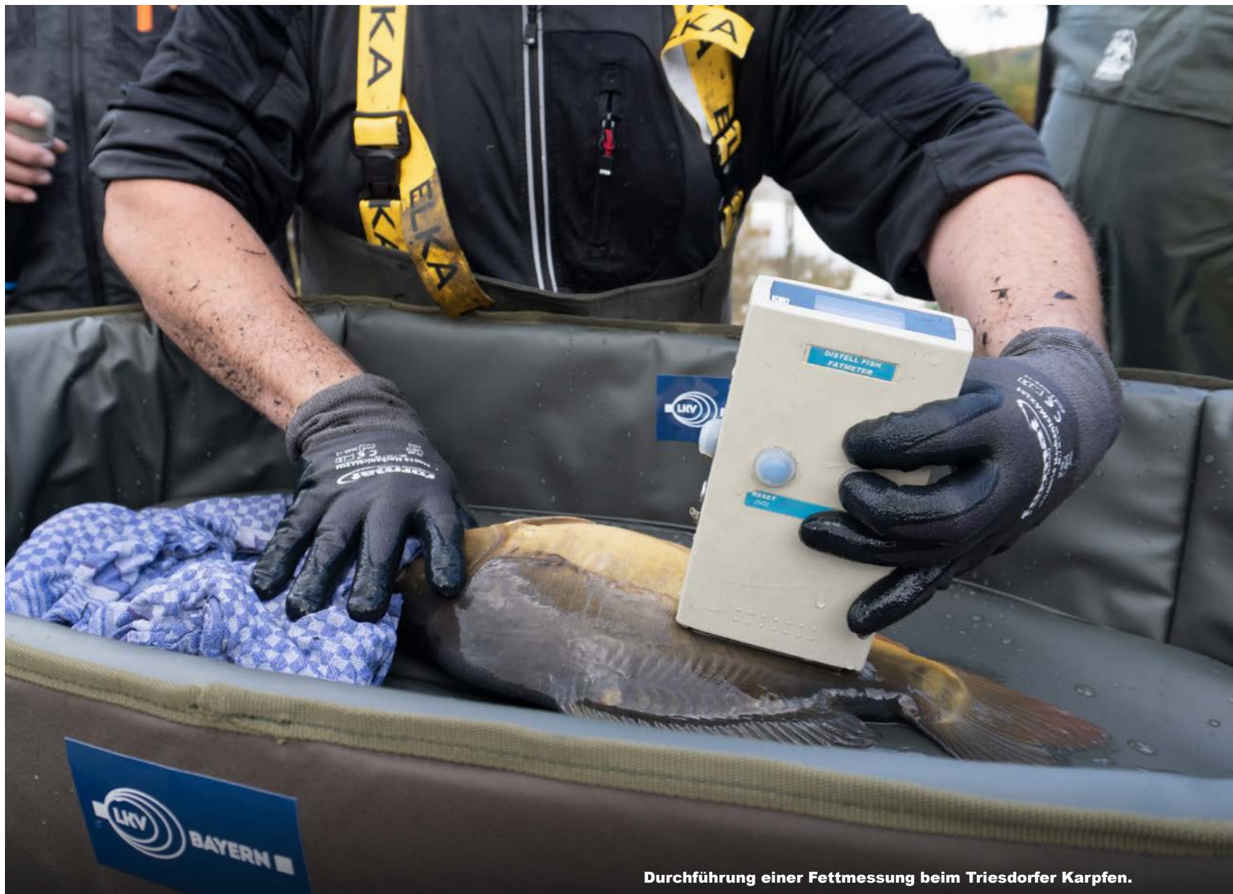
Durchführung einer Fettmessung beim Triesdorfer Karpfen.