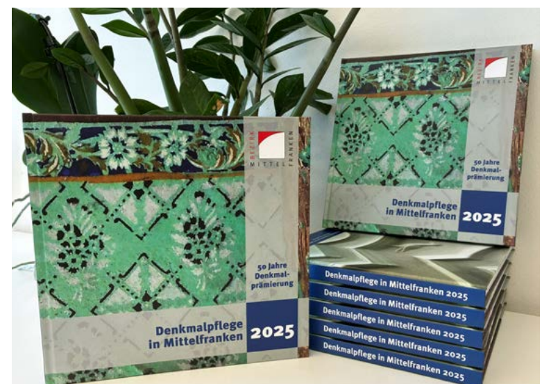
Im Begleitband zur Denkmalprämierung finden sich Vorzustandsbilder und ausführliche Beschreibungen zu den besonders vorbildlich sanierten Objekten.

Zum Jubiläum ist eine Infobroschüre erschienen. Sie steht auf der Website des Bezirks zum Download bereit und kann bei der Bezirksheimatpflege Mittelfranken unter denkmalpraemie-rung@bezirk-mittelfranken.de oder 0981 4664 50002 kostenlos angefordert werden.