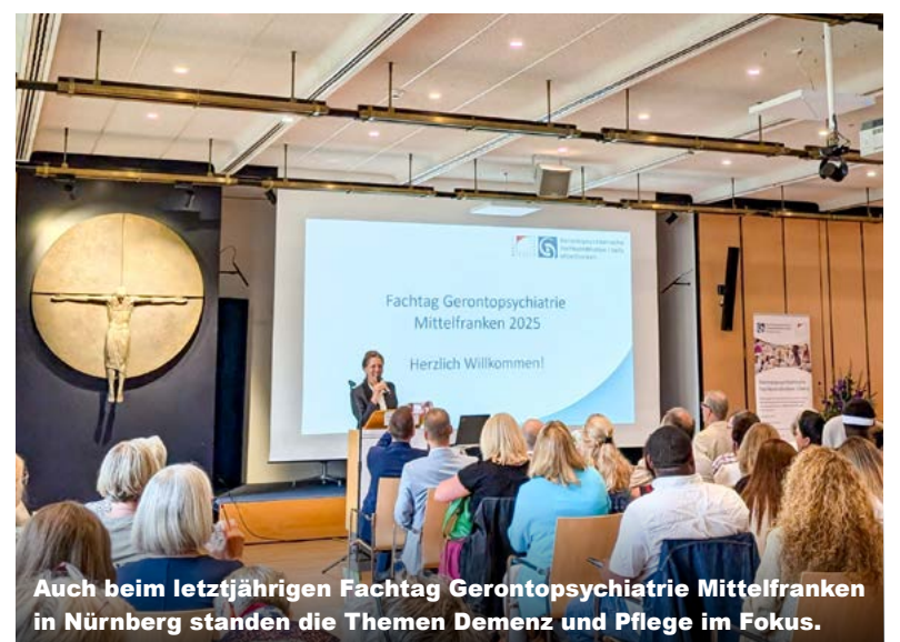
Auch beim letztjährigen Fachtag Gerontopsychiatrie Mittelfranken in Nürnberg standen die Themen Demenz und Pflege im Fokus.

Tel.: 0981/4664-20210 Mail: info@demenz-pflege-mittelfranken.de