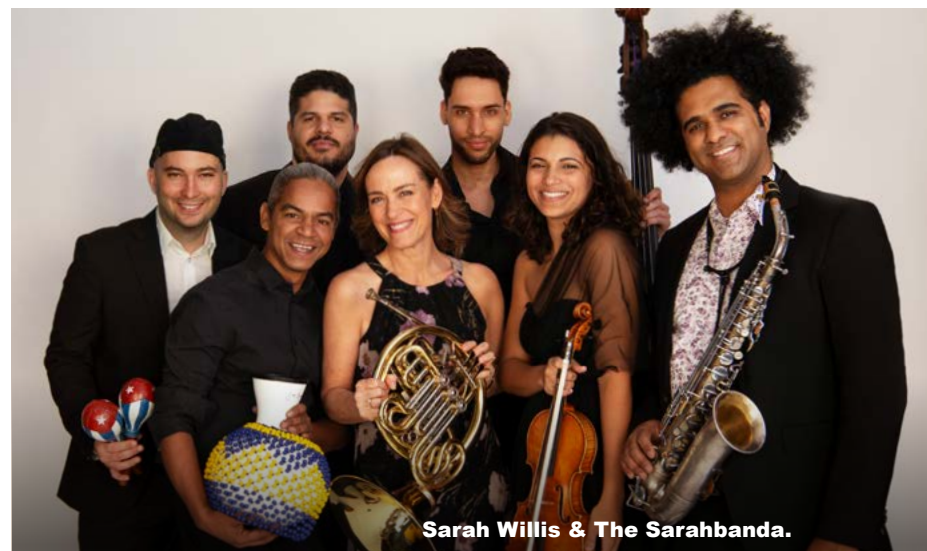
Sarah Willis & The Sarahbanda.

Dieses Konzert ist weit mehr als ein musikalischer Abend: Es ist ein Fest der Kulturen, voller Virtuosität, Charme und Energie. Ein Muss für alle, die Mozart lieben und den Mambo im Herzen tragen. Karten sind erhältlich über Eventim, an den Vorverkaufsstellen sowie über die Webseite www.fraenkischer-sommer.de . Dort gibt es auch weitere Informationen.